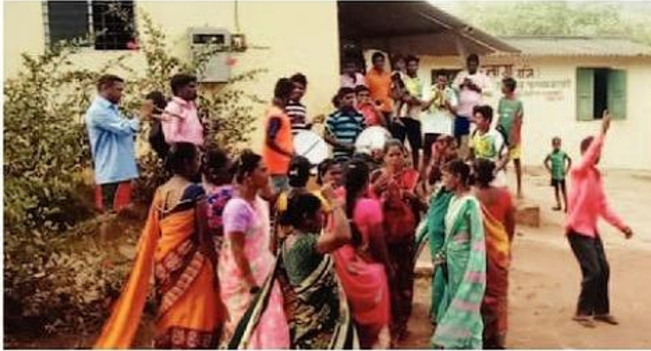
जामझाड या आदिवासी पाड्यात शुक्रवारी वीज आल्यानंतर असा जल्लोष करण्यात आला.

भाईदरच्या उत्तन - गोराई मार्गापासून सुमारे तीन किमी आत डोंगराच्या खाली वसलेला जामझाड हा ५२ उंबरठ्यांचा आदिवासी पाडा. मुंबईच्या हद्दीत आणि भाईदरच्या वेशीवर असलेल्या या पाड्यात जेमतेम दोनशेची लोकवस्ती आहे. भाईदर येथील प्रसिद्ध केशवसुष्टी - रामभाऊ म्हाळगी प्रबोधिनी आणि रामरत्नसारखी आलिशाळा याच भागात आहे. देशाच्या ज्युडिशीयल अकादमी पासून हा पाडा हाकेच्या अंतरावर आहे. लोकप्रतिनिधी,